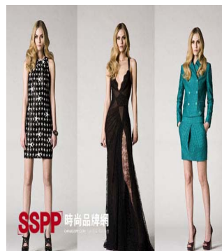
圖 2-4 六十年代服飾