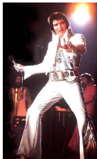
圖 2-6 阿哥哥風