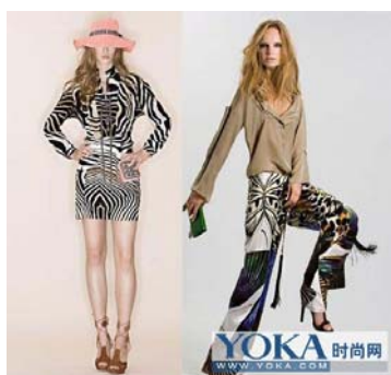
圖 2-1 六十年代服飾