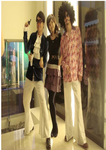
圖 2-7 七十年代流行服飾

1970 年代從西方傳來一種普普的藝術風格，在這個時代捲起了阿哥哥的流行風潮，幾何形狀的衣服、假髮加上大頭巾，大鏡框的太陽眼鏡、彩色花紋的絲襪.....等等。這些人幾乎都同時具備著傳統與反傳統，懷舊與顛覆的性格。可以說這是一個從守舊到開放的過渡時期。時下最夯的復古風，漸漸在街頭捲起，從六十年代的迷你裙、圓頭鞋、大膽的眼妝，到七十年代的阿哥哥裝扮，幾乎都成為現代新流行的風潮。七十、八十年代具備著傳統與反傳統、懷舊與顛覆的性格。