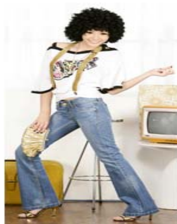
圖 2-9 七十年代流行服飾