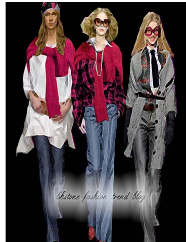
圖 2-8 七十年代流行服飾