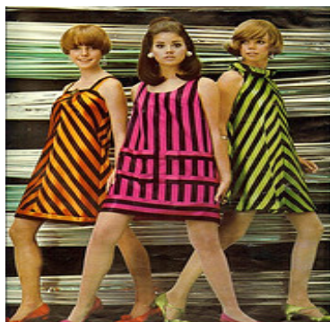
圖 2-3 六十年代服飾