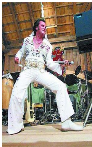
圖 2-5 阿哥哥風格

舞曲也有很大的差別。以前的西洋歌曲除了節奏以外，也非常重視歌曲的旋律和歌詞意義，甚至特殊的品味，一首只知道敲敲打打的歌很難受到青睞或者長期重視，不過隨著時代的演變，從 Disco (迪斯可) 風開始，風味便有所變化。