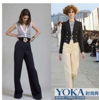
圖 2-2 六十年代服飾