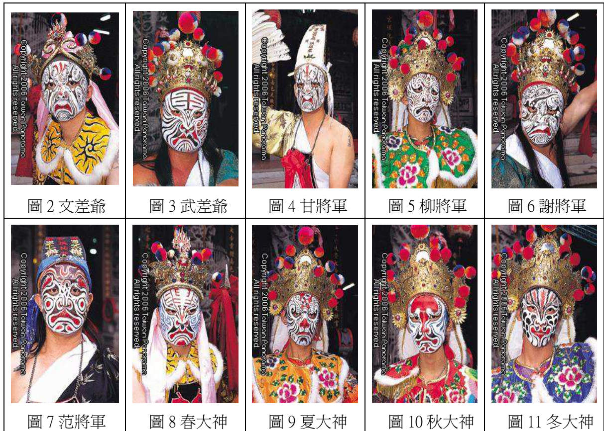
表 1 八家將臉譜圖片欣賞