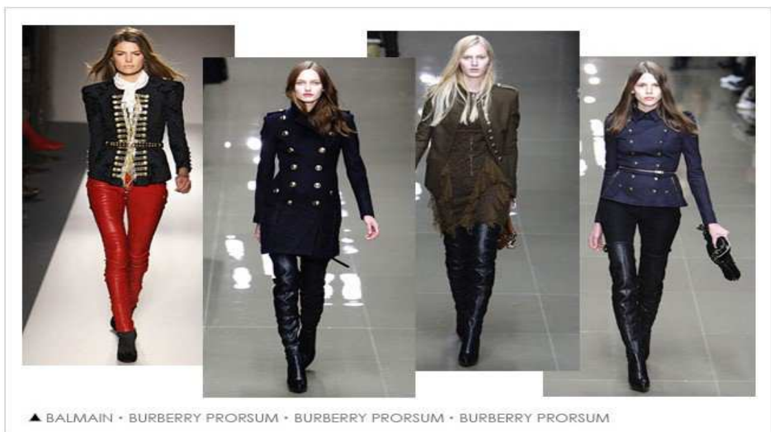
圖 17 時尚走秀-個性軍裝風

延燒了好幾個年頭的軍裝風格，已經成為時尚舞台上的大熱趨勢，洗鍊的剪裁和硬挺的線條，充分表現女性果斷與堅強的自信氣質。來到 2011 秋冬，軍裝風格走向一種更細緻的追求，強調立體感的肩部造型與帶了原有單純的反摺設計，經典的雙排釦，也由整齊緊密排列的金釦來表現，並以鉚釘垂鍊和金色刺繡鑲邊做裝飾，顏色上也不再拘泥於傳統軍綠和卡其色，而且更廣泛使用的黑色和午夜藍等色彩來增添新鮮感，款式上，不論是短版的拿破崙式外套或是長版的軍旅大衣，都是很出色的單品。