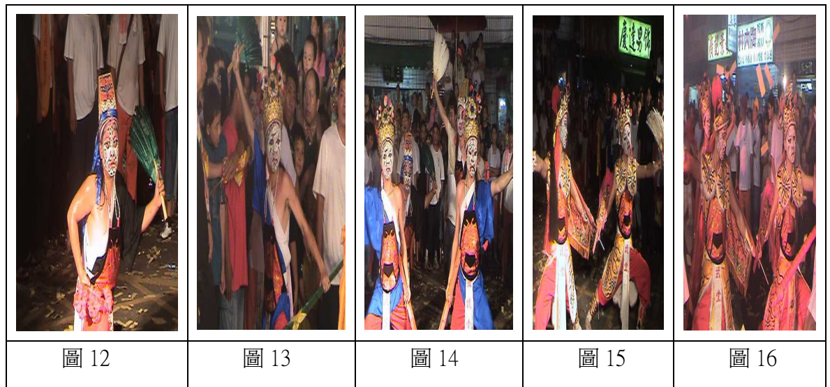
表 2 八家將服飾

傳統之八家將服裝，以尊嚴與美觀並具耐穿為目的，故其衣服的縫製方法也以簡單裁剪為主要方式，亦有稍考慮其機能性。其做法為：