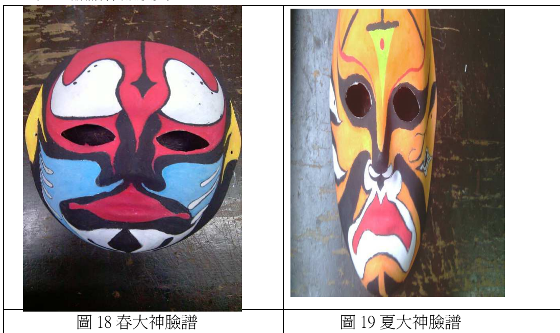
表 3 臉譜作品欣賞

重新解讀、解構、重現，八家將臉妝以及現代彩妝的細微美學轉變。呈現對比與衝突並列的美學概念