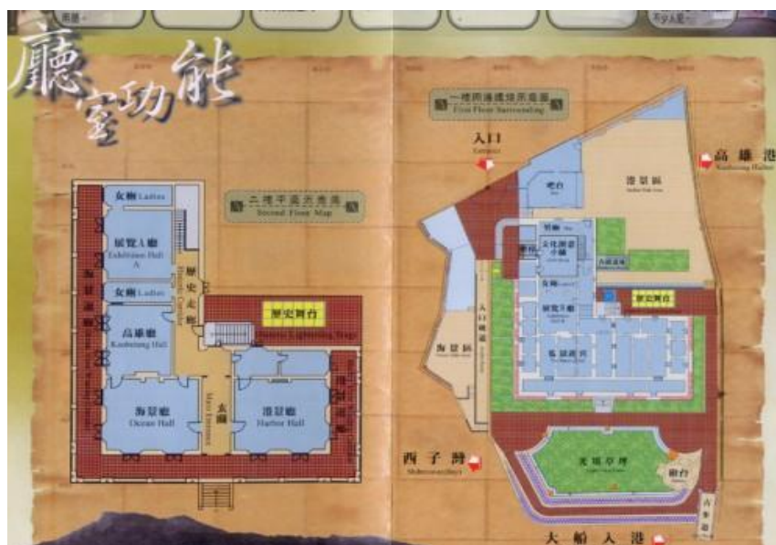
圖 2-2 打狗英國領事館空間圖