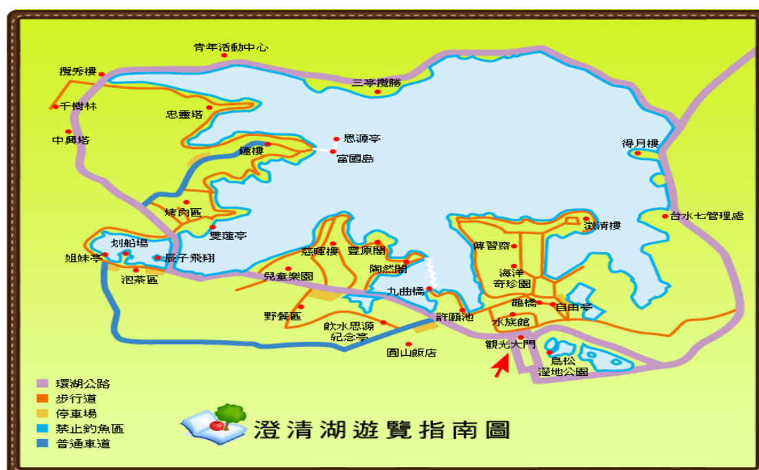
(圖一，引註資料: http://chengcinglake.water.gov.tw/chinese/outline_1-2.asp )

(引註資料: http://www.shs.edu.tw/works/essay/2011/11/2011111423581121.pdf )