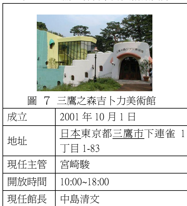
表 5 三鷹之森吉卜力美術館簡介

三鷹之森吉卜力美術館裡面所展示的是有關於動畫原理，以及原始的動畫，能了解到歷年的吉卜力原稿的內容。其中有小孩可以遊玩的龍貓公車；圖書館也有書籍可以閱讀及購買；映像展覽室也撥放了美術館專用的動畫電影；草帽咖啡廳也提供獨創的餐點；商店「曼馬由特」也有販賣吉卜力工作室及企劃展示內容相關的紀念品。