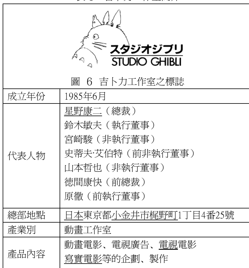
表4 吉卜力工作室簡介

Ghibli原本是義大利文，其意思為撒哈拉沙漠吹的熱風，在第二次世界大戰期間義大利所用的偵察機之名為Ghibli，本身對於飛機就相當有興趣的宮崎駿便建議將它取為工作室的名字，期望吉卜力工作室能在日本的動畫界中成為耀眼的一顆星星，於1997年6月和母公司德間書店歸併，而後於2005年4月獨自成為株式會社吉卜力工作室。