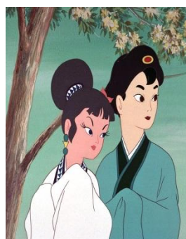
圖 4 白蛇傳