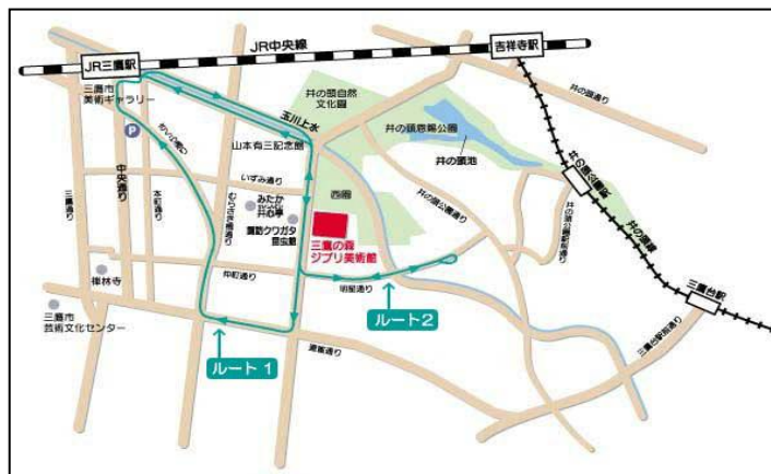
圖 8 三鷹之森吉卜力美術館位置圖

三鷹之森吉卜力美術館裡面所展示的是有關於動畫原理，以及原始的動畫，能了解到歷年的吉卜力原稿的內容。其中有小孩可以遊玩的龍貓公車；圖書館也有書籍可以閱讀及購買；映像展覽室也撥放了美術館專用的動畫電影；草帽咖啡廳也提供獨創的餐點；商店「曼馬由特」也有販賣吉卜力工作室及企劃展示內容相關的紀念品。