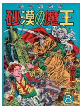
圖 3 沙漠的魔王

高中開始接觸繪畫，在1958年東映動畫的《白蛇傳》在宮崎駿心中留下了非常強烈的印象，使宮崎駿開始思考自己是否應該更坦率地去表現自己認為的好與美，而開始對動畫產生興趣。