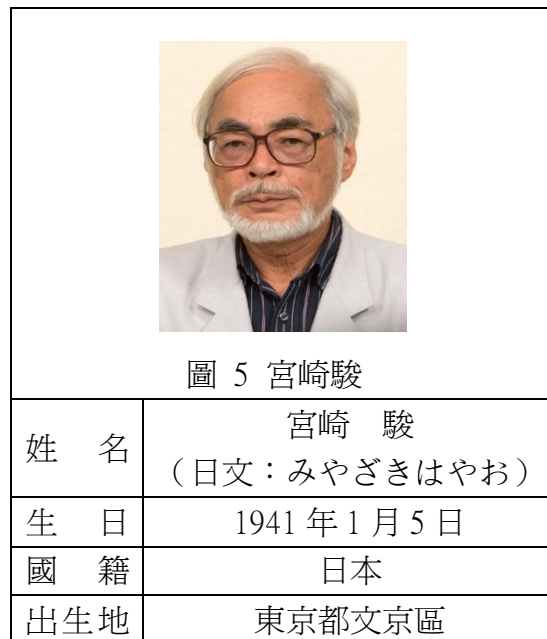
表 1 宮崎駿簡介

宮崎駿是一位很即興創作的動畫製作人，他的創作方式跟其他人不一樣，宮崎駿經常是一邊創作、一邊決定內容。作品大部分都和人類與自然之間的關係、女權運動、和平主義有關。他的作品也常常出現青春期的思想、兒童心理、飛行，像是《天空之城》、《龍貓》、《魔女宅急便》等等，皆與飛行有關。