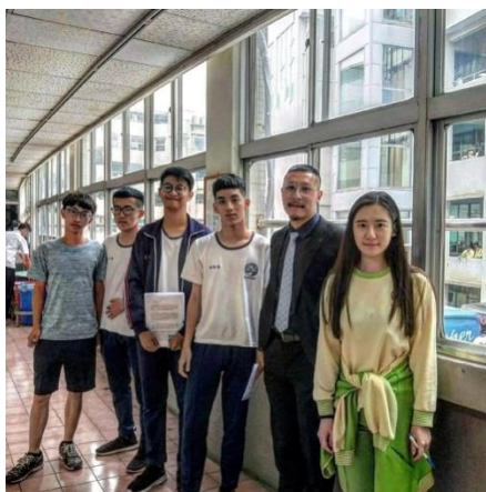
圖五：與陳先生的合照