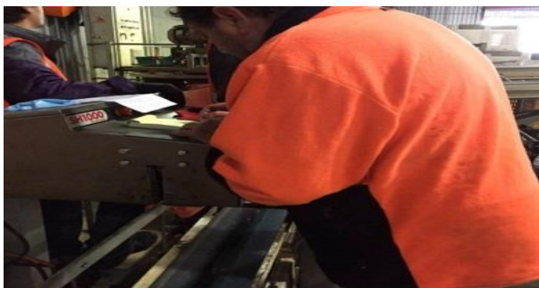
圖一、陳先生在工廠的包裝工作