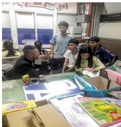
圖六：實際訪談有經驗者