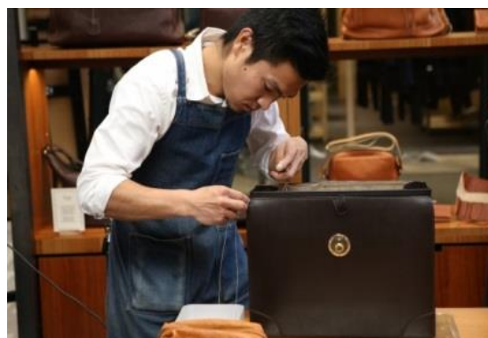
圖 2：頂尖製皮革大師

(圖 1 資料來源： https://www.google.com.tw/search?q )