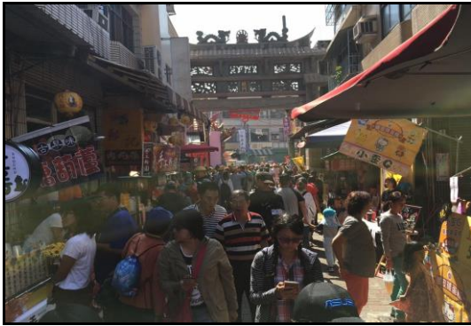
圖十七：廟會美食街

明一起降臨凡間。當地信眾或遊客可在參拜完或繞境途中購買各式各樣的台式傳統美食，例如：大腸包小腸、臭豆腐、臭臭鍋、鹹酥雞、糖葫蘆等等。