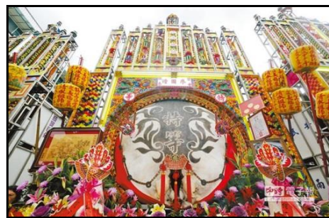
圖五：三峽祖師祭