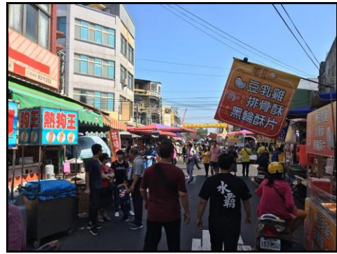
圖十八：廟會周邊傳統美食