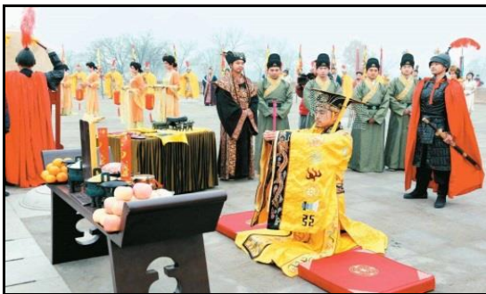
圖一：中國古代皇帝祭天

幾千年來，華夏民族尊崇天地神靈的敬畏之心亙古不變，身為炎黃子孫，我們都有義務去維護這項無價的文化遺產，因為它們代表著人類文明重大邁進的里程碑之象徵。