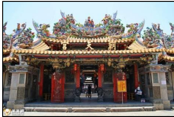
圖九：北港朝天宮

「北港迎媽祖」盛典聞名全台，吸引信眾數萬人。一年之中舉辦兩次，分別為農曆正月 15 日進行，另一次則為農曆三月 19、20 兩日。北港家家戶戶都會辦桌宴客，邀請遠方的親友們共襄盛舉。沿街民眾也會在廟方人員引導下排成一直線，接受「鑽轎腳」的洗禮。而關於朝天宮的傳說故事，最著名的莫過於家喻戶曉的「北港孝子釘」了。朝天宮也於每年正月初一子時抽國運籤，同樣極為受到全國關注。今年抽出中平籤，詩文內容為「順應環境變化，不要強求，安心守分地過生活。」