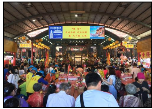
圖十四：廟會祭拜人潮