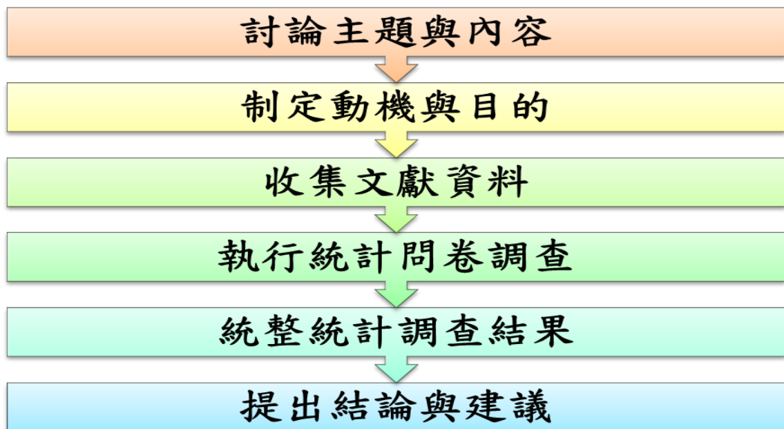
圖三：研究架構流程圖