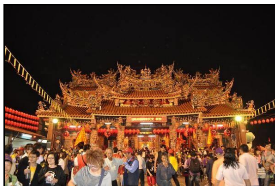
圖八：大甲鎮瀾宮

鎮瀾宮也於每年正月初一子時抽國運籤，極為受到全國關注。今年已是連續第三年抽出中籤，標題為「秦瓊救李淵」，內容為「月初光輝四海明，前途祿位見太平，浮雲掃退終無事，可保禍患不臨身。」大甲媽祖繞境被政府指定為「國重要民俗無形文化資產」，更被 Discovery 探索頻道列為世界三大宗教盛事之一。