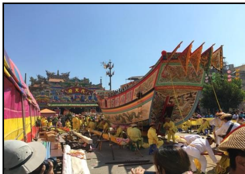
圖十一：廟埕上的王船

舉辦廟會期間，最熱鬧的地點莫過於廟宇與廟埕兩個場地了。無論是鑾駕啟程與回鑾、舞龍舞獅、炮竹燃放或是歌仔戲與布袋戲的演出，皆在廟宇前的廟埕上盛大展示。在這期間，成千的人們聚集在廟埕上，有的誠心參拜，有的欣賞傳統藝術，整個廟埕好不熱鬧呢！