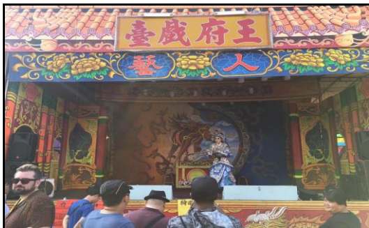
圖十五：歌仔戲

舉辦廟會期間，時常可在廟埕上看見高築的戲台上，幾位濃妝豔抹的歌仔戲演員們手舞足蹈，演繹著流傳千古的神話與歷史傳奇；也可看見幾隻栩栩如生的木偶，各個表情生動、能歌擅舞。有的刀劍相對，有的飲酒吟詩，可一點都不輸真人演員呢！