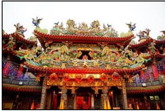
圖十：白沙屯拱天宮