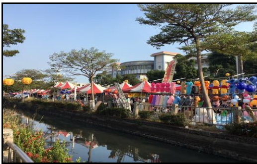
圖十九：廟會周邊娛樂