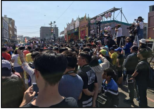
圖十三：廟會觀賞與拍攝人潮

廟會與繞境可吸引大量人潮，人數可能因該廟宇的知名度而影響，少則數百，多則上萬。觀賞與拍攝之人潮大多聚集在廟宇週邊，等待著重頭戲的到來。而參與祭拜的人數也十分眾多，時常將廟宇內部擠得水洩不通，一不小心都可能有被線香燙傷的可能，必須小心注意。而由於參拜人數大量，偶爾可聽聞廟宇內的天公爐或是正殿的香爐「發爐」，通常被人們視為神蹟顯現的象徵。