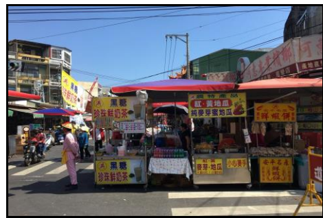
圖二十：廟會周邊傳統小吃