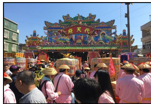
圖十二：東港代天府