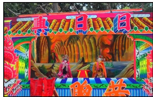
圖十六：布袋戲