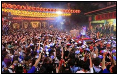
圖四：大甲媽祖繞境

現代廟會主要在農曆春節期間舉行最為普遍及盛大，如：搶頭香、走春祭拜等；其次為特定神明壽誕或節日之慶典，如： 天公生 、 媽祖生 、 三峽祖師祭 、中元普渡搶孤等；以及各地的宮廟進香最為普遍。廟會更結合了台灣傳統文藝—歌仔戲及布袋戲。此兩種戲曲歸類為酬神戲曲，是為了答謝神明庇佑，特定選在聖誕千秋日，以戲台的方式呈現於廟埕。