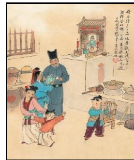
圖二：中國古代祭祖