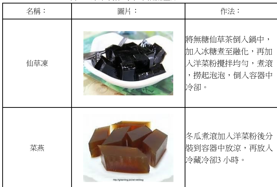
表 2、洋菜製作的果凍相關產品