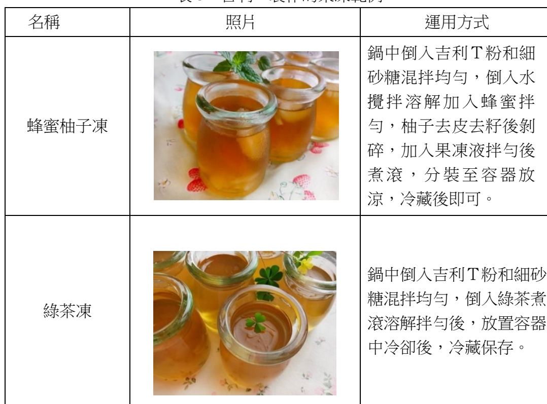
表 3、吉利 T 製作的果凍範例