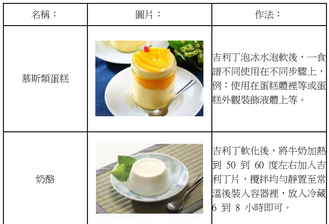
表 1、吉利丁製成的果凍相關產品