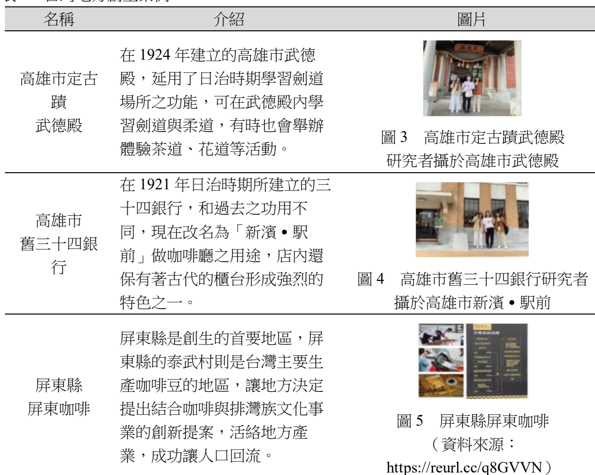
圖 3 高雄市定古蹟武德殿