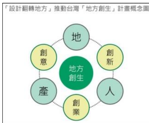
圖 2：「設計翻轉地方」推動台灣「地方創生」計畫概念圖

「城鎮、人、工作創生法」，此名稱來自於日本，而新瀉縣燕三条工場祭典策畫單位玉川堂委員長山三田立曾於 2019 年 11 月 1 日時所舉辦的地方創生展上指出「 地方創生應該不是創造新的事物，而是重新看待地方 」(林吉洋，2019)，而地方創生的中心思想為「產，地，人」，以在地文化及人文風光為基礎，去加以打造各個地區所擁有的不同特色。日本在 2014 年提出「地方創生政策」，並將「地方創生」此詞發揚至國際間，而在日本成功地方創生且活躍的案例比比皆是，而我國也以此為借鏡，將 2019 年宣布為「台灣地方創生元年」，國家發展委員會於 2018 年提出「 希望能達成復興地方產業、在都市外地區創造就業人口，並且促進人口回流，達成『均衡台灣』目標。 」