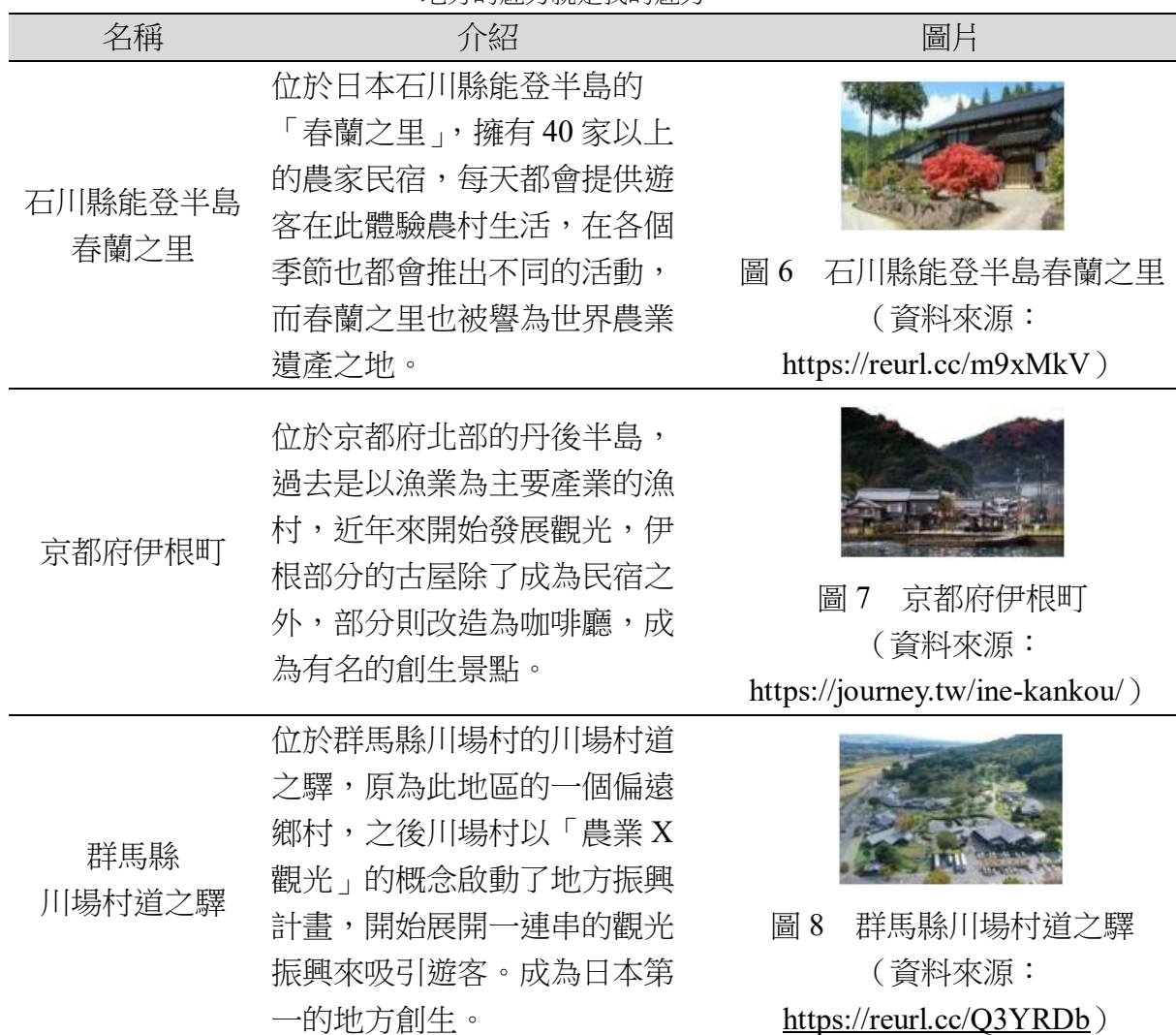
圖 6 石川縣能登半島春蘭之里